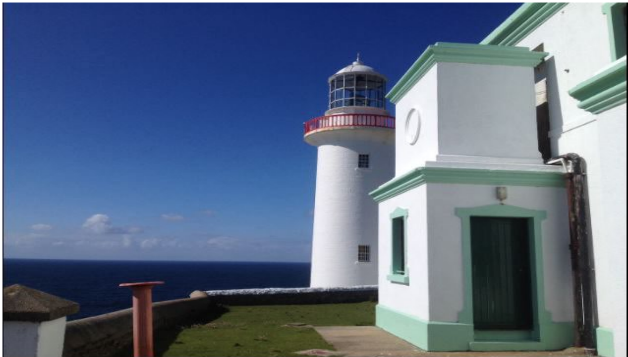
Teach Solais, Árann Mhór