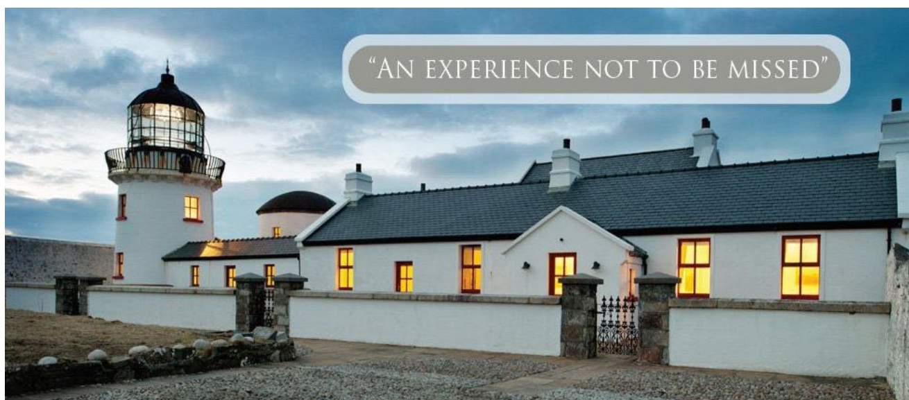
Teach Solais Oileán Chliara