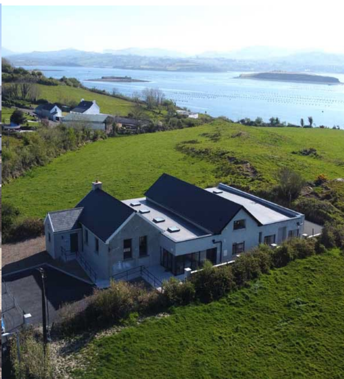
Brú Oileán Faoide