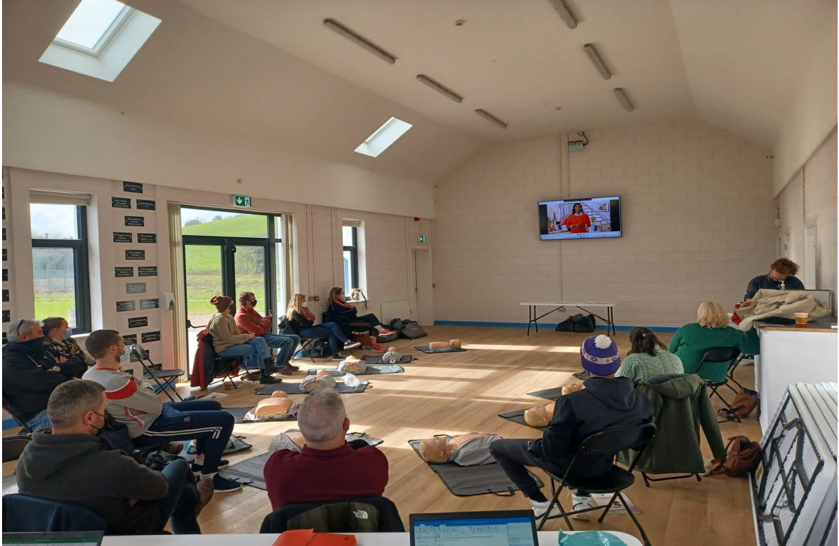
Rannpháirtithe ó Oileáin Chorcaí ag tarenáil difhibrileoir ar Oileán Faoide