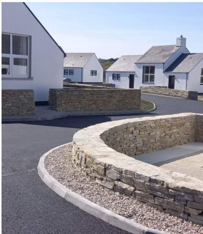
Baile Saoire Árainn Mhór

Fág an saol laethúil i do dhiaidh agus tar linn chuig na flaithis ar Domhan le tránna ghainimheach bhána, uiscí soiléire criostail, síocháin agus ciúnas glórmhar.