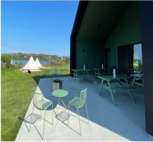
Wild Atlantic Glamping, An tOileán Mór