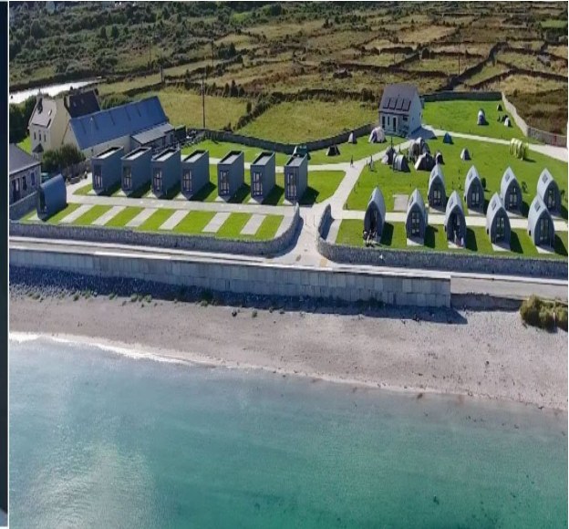
Aran Islands Glamping, Inis Mór